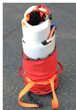
アウトースキッドを取り付けたまま収納することができます。