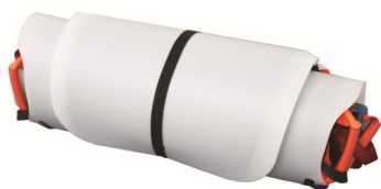
パーティカルストレッチャーにアウトースキッド取り付けて丸めた状態