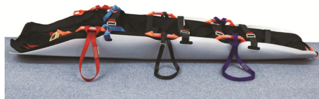
パーティカルストレッチャーに取り付けた状態